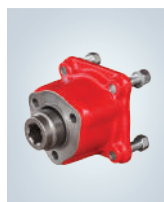
UNI 3T. - ISO 4T