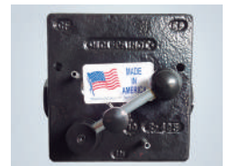
REGULADORA DE FLUJO