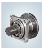
ISO 4T. PLATO SAE 1400