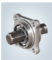
ISO 4T. - EJE Ø1 1/4